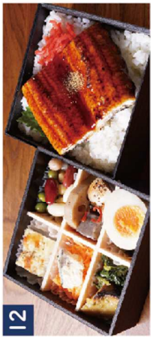
12 装のうな重《一年中ふっくら肉厚の鰻をお楽しみいただけます》 ¥1,980(税込)