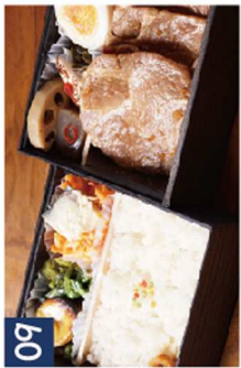
09 王道!生姜焼き※チキンソテーに変更可 《ちょうどいい二段重》 ¥1,580(税込)