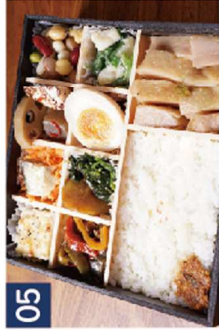
05 チキンソテー 柚子胡椒添え※生姜焼きに変更可 《煌びやか宝箱》 ¥1,480(税込)