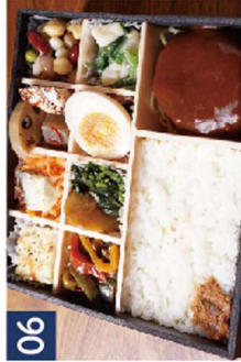
06 牛100%ハンバーグ※鯖の塩焼き、陸ハラスに変更可 《煌びやか宝箱》 ¥1,700(税込)