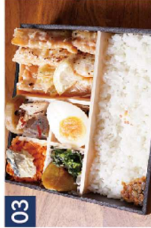
03 陸ハラスねぎ塩レモンだれ※鯖の塩焼きに変更可 ¥1,200(税込)