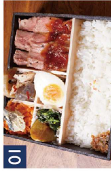
01 サーロインステーキ※牛焼肉に変更可 ¥1,080(税込)