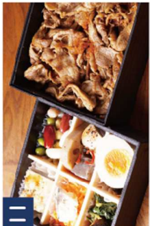
11 牛焼き肉敷き詰め重《装のお重》 ¥1,650(税込)