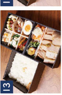
13 豪快!チキンソテー※生姜焼きに変更可 《希少!彩り華やかな三段重》 ¥1,980(税込)