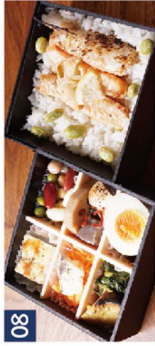
08 お豆の炊込みご飯ON陸ハラス焼き《装のお重》 ¥1,650(税込)