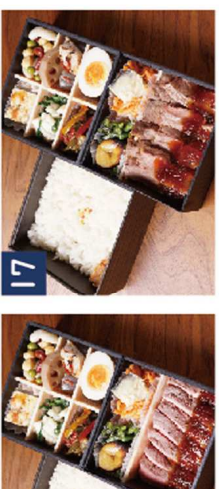
17 豪快!サーロインステーキ牛 《希少!彩り華やかな三段重》 ¥2,820(税込)

◆ご注文は下記に数量を記入しFAXをご送信又はお電話にてご注文くださいませ 定期便・大口注文などのご相談も承ります。お気軽にお問い合わせくださいませ