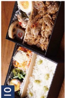
10 お豆の炊込みご飯と牛焼き肉敷き詰め丼 《ちょうどいい二段重》 ¥1,320(税込)