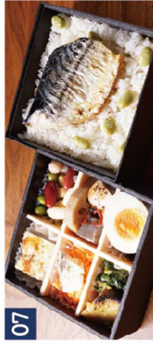
07 お豆の炊込みご飯ON鯖の塩焼き《装のお重》 ¥1,650(税込)