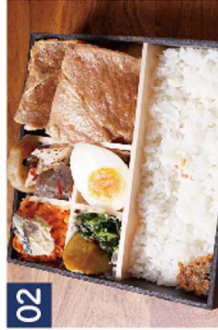
02 王道!生姜焼き※チキンソテーに変更可 ¥980(税込)