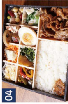
04 牛肉ストライク※サーロインステーキ牛に変更可 《煌びやか宝箱》 ¥1,620(税込)