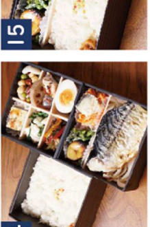
14 豪快!鯖の塩焼き※陸ハラスに変更可 《希少!彩り華やかな三段重》 ¥2,320(税込)